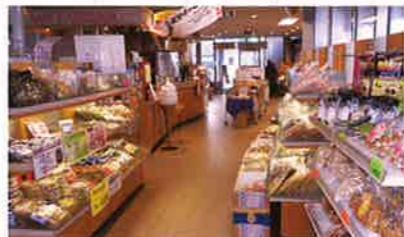
特産品センター「ふたみんC」