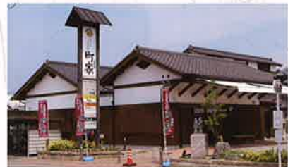
手づくり交流市場「町家 まちや」