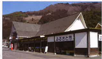
なかやま特産品センター